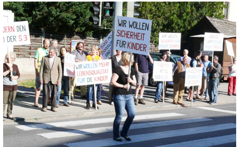
Die Schönggrabener Bevölkerung machte sich die Mühe der Demo umsonst. Der Fließverkehr wurde umgeleitet.

Dann ereignete sich knapp vor 8 Uhr ein schwerer Unfall kurz vor dem Ortsgebiet von Schönggrabern aus Richtung Grund. Worauf die B 303 in beiden Richtungen wegen des Rettungs- und Feuerwehreinsatzes für mehr als eine Stunde gesperrt und der Verkehr großräumig umgelei-