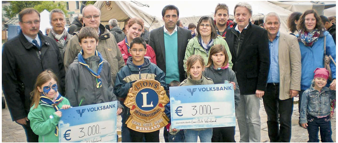
Pfadfinder und Kindergarten können sich über die Spenden des Lionsclub freuen.

Ein Obdachloser nennt ihn Noah, das steht in seiner Hand eingeritzt. Noah leidet an Gedächtnisschwund, weiß nicht wer er ist. Aber er entdeckt an sich Fähigkeiten eines Profi-Killers - und er spielt eine Schlüsselrolle in einem weltweiten Massenmord: Eine Pandemie soll die Überbevölkerung regulieren. Ein rasanter, packender Thriller voller überraschender Wendungen! Bastei Lübbe, 559 S., 20,60 € Georg Larcher