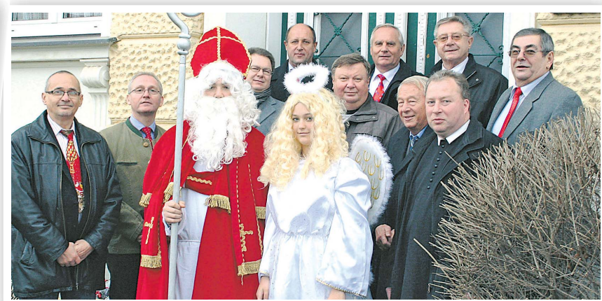
SEEFELD-KADOLZ | Ein schöner Brauch – in Seefeld-Kadolz besuchten Nikolo und Engel aus Tschechien die Kinder und in der Partnergemeinde Jaroslavice kam der Nikolo aus Seefeld-Kadolz. Im Bild Gemeindemandatare aus Seefeld-Kadolz mit dem Nikolo aus Jaroslavice.