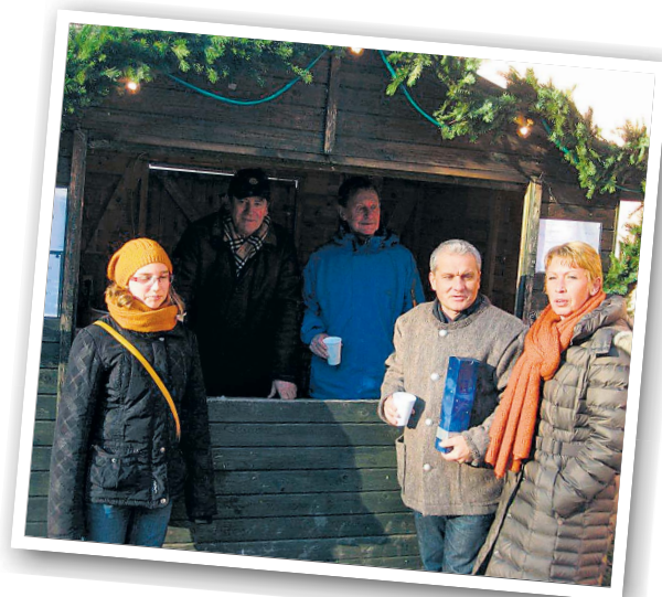
HOLLABRUNN | Nationalrat Christian Lausch erfreute sich am Angebot beim Adventmarkt in der Alten Hofmühle.