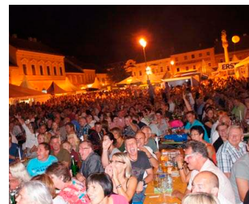
Der Laaer Stadtplatz war beim Auftritt von The Real ABBA Tribute komplett voll.