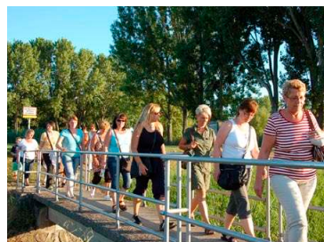
Die Mondscheinwanderung kam bei den Mitarbeitern des Pflegeheims gut an.