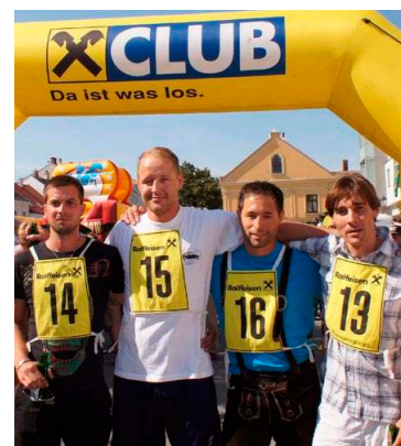
Team Remezzo ließ die Konkurrenz beim Zwiebelstaffellauf hinter sich.